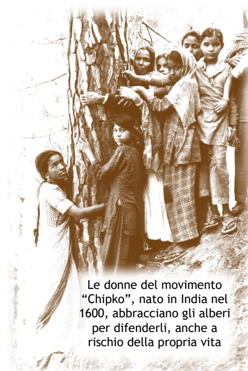
Le donne del movimento "Chipko", nato in India nel 1600, abbracciano gli alberi per difenderli, anche a rischio della propria vita